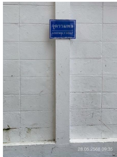
ภาพที่ 18 แสดงป้าย “จุดรวมพล”