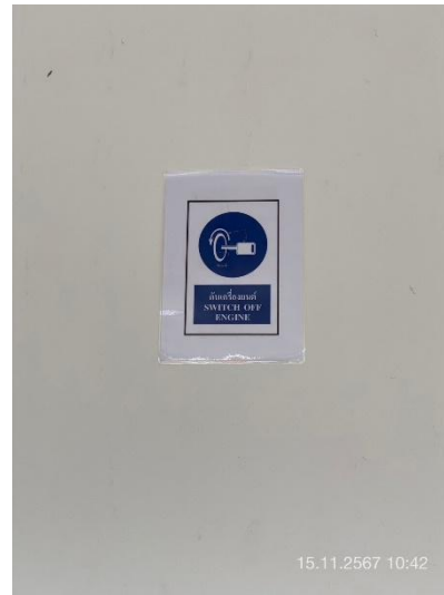
ภาพที่ 6 แสดงป้าย “ดับเครื่องยนต์”