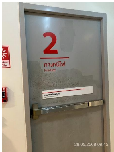
ภาพที่ 17 แสดงประตูทางหนีไฟ