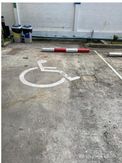
ภาพที่ 3 แสดงที่จอดรถสำหรับคนพิการ