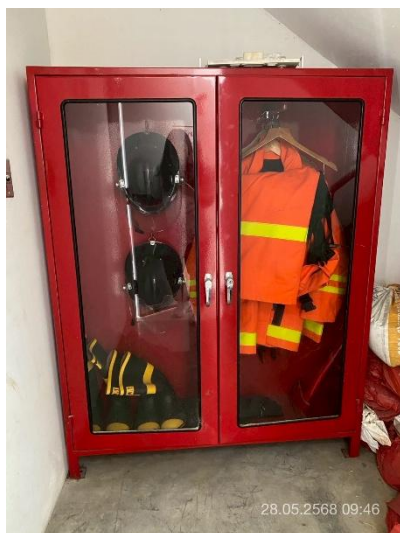
ภาพที่ 11 แสดงตู้เก็บชุดและอุปกรณ์ดับเพลิง