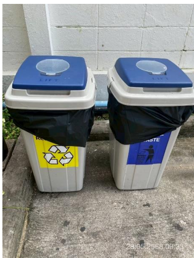
ภาพที่ 15 แสดงถังขยะแยกประเภท บริเวณด้านหน้าอาคาร