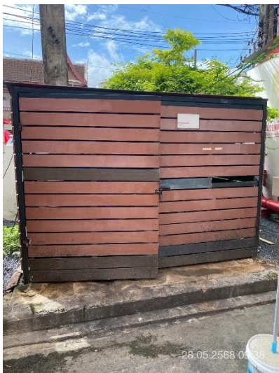
ภาพที่ 7 แสดงห้องพักขยะเปียกและขยะแห้ง