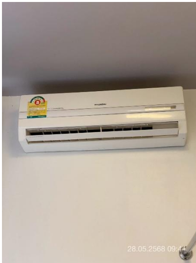
ภาพที่ 5 แสดงเครื่องปรับอากาศประหยัดไฟเบอร์ 5