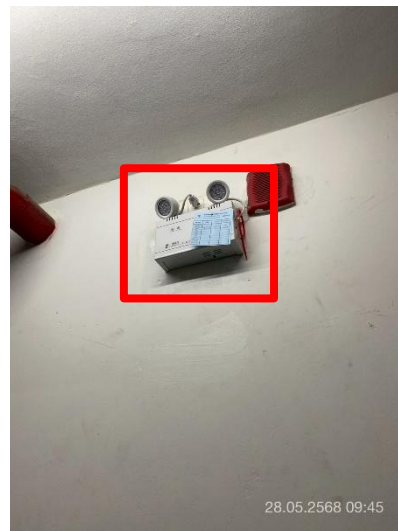
ภาพที่ 28 แสดงไฟฉุกเฉินภายในอาคาร