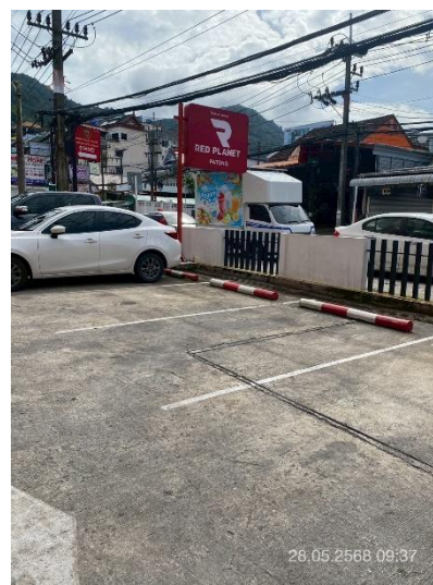
ภาพที่ 10 แสดงลานจอดรถยนต์ภายในโครงการ