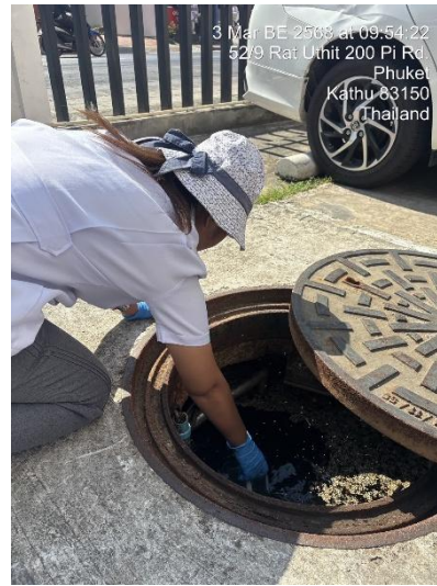
ภาพที่ 38 แสดงจุดเก็บตัวอย่างน้ำทิ้งหลังบำบัด