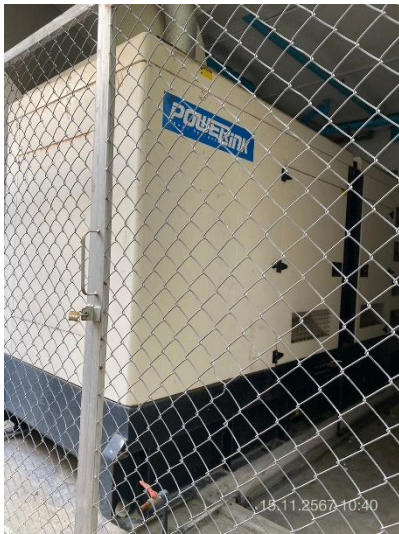
ภาพที่ 37 แสดงห้องเครื่องกำเนิดไฟฟ้า