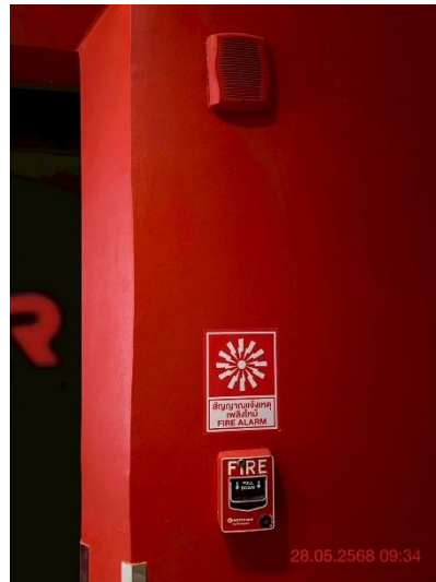
ภาพที่ 8 แสดงสัญญาณเตือนภัยแบบมือดึง