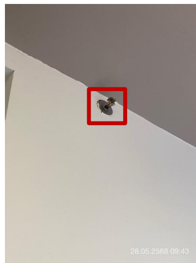
ภาพที่ 4 แสดงหัวกระจายน้ำดับเพลิงอัตโนมัติภายใน ห้องพักแขก