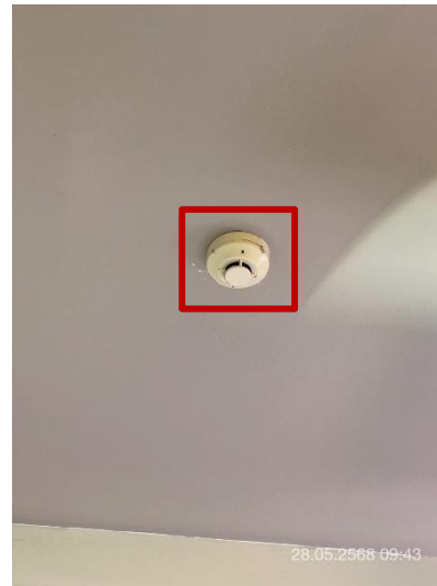
ภาพที่ 22 แสดง Smoke Detector ภายในห้องพัก