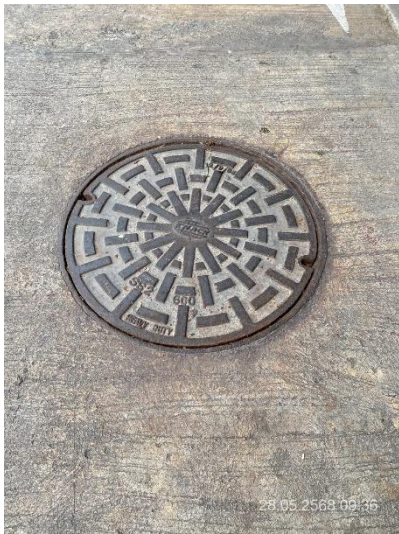
ภาพที่ 29 แสดงฝาท่อ “ระบบบำบัดน้ำเสีย” ด้านล่างพื้น ถนน