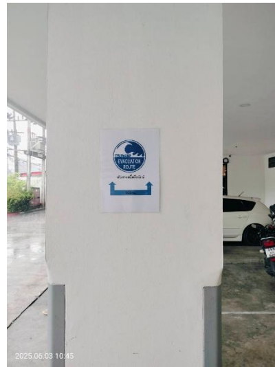
ภาพที่ 30 แสดงป้าย “เส้นทางหนีคลื่นยักษ์” บริเวณ ด้านหน้าโครงการ