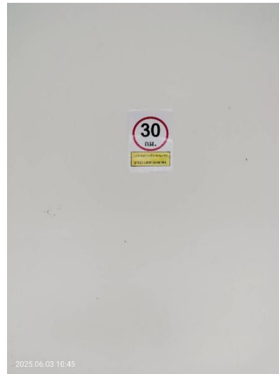
ภาพที่ 26 แสดงป้ายจำกัดความเร็ว 30 กิโลเมตรต่อชั่วโมง