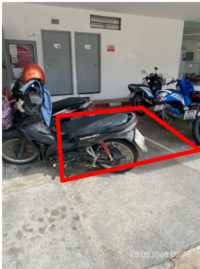
ภาพที่ 33 แสดงบ่อหน่วงน้ำฝนใต้ลานจอดรถ