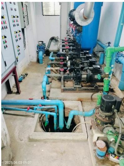
ภาพที่ 23 แสดงห้องปั้มน้ำและถังเก็บน้ำใต้ดิน