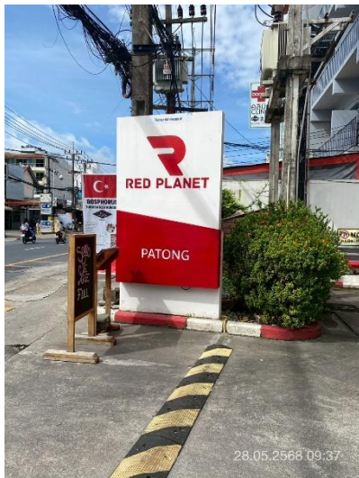
ภาพที่ 1 แสดงป้ายชื่อโครงการ