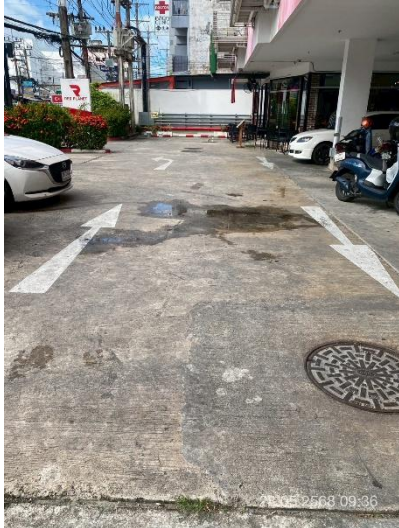
ภาพที่ 13 แสดงสัญลักษณ์จราจรภายในโครงการ