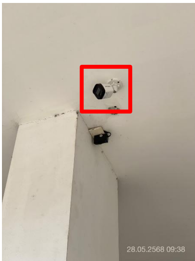
ภาพที่ 27 แสดงกล่องวงจรปิดบริเวณลานจอดรถ และ ทางเข้า-ออก