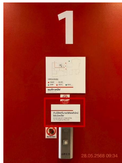
ภาพที่ 16 แสดงป้ายคำเตือนในการใช้ลิฟต์ บริเวณหน้าลิฟต์