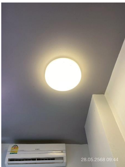
ภาพที่ 31 แสดงหลอดไฟ ชนิดประหยัดพลังงาน LED