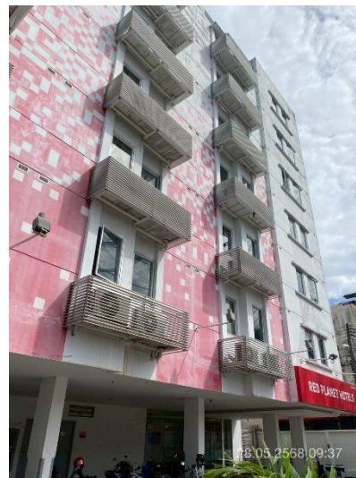
ภาพที่ 2 แสดงภูมิสถาปัตยกรรมของโครงการ