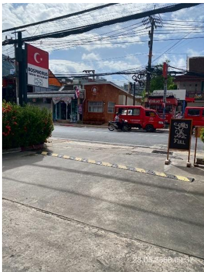
ภาพที่ 35 แสดงทางเข้า-ออกโครงการ