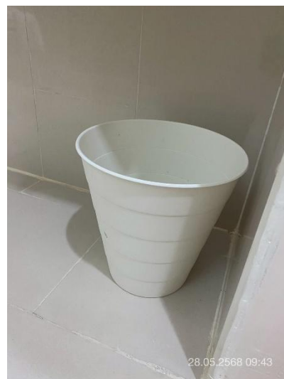
ภาพที่ 32 แสดงถังขยะภายในห้องพัก