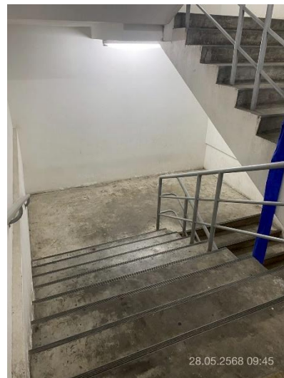
ภาพที่ 36 แสดงบันไดหนีไฟ