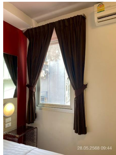
ภาพที่ 24 แสดงหน้าต่างระบายอากาศภายในห้องพัก