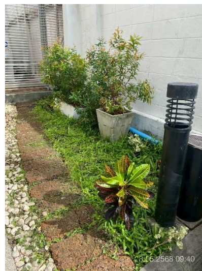
ภาพที่ 12 แสดงพื้นที่สีเขียว