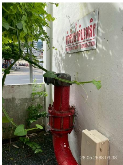
ภาพที่ 19 แสดงหัวรับน้ำดับเพลิงจากภายนอก