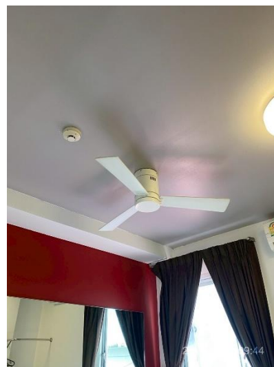
ภาพที่ 20 แสดงพัดลมภายในห้องพักแขก