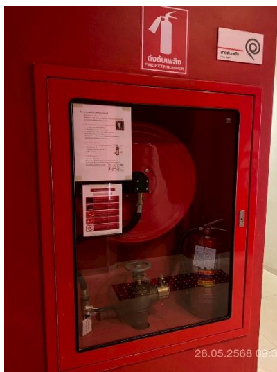
ภาพที่ 9 แสดงถังดับเพลิงและอุปกรณ์ดับเพลิง