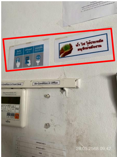
ภาพที่ 21 แสดงป้ายรณรงค์ประหยัดน้ำ/ประหยัดไฟ