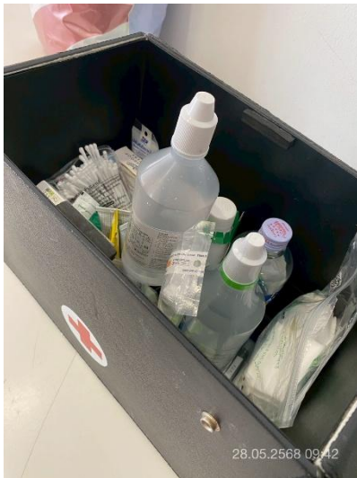
ภาพที่ 25 แสดงกล่องปฐมพยาบาล